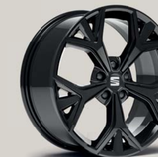
EXCLUSIVE 36/10 GLOSSY BLACK FR