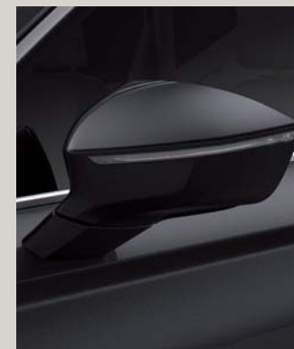
CRYSTAL BLACK 2