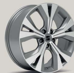
PERFORMANCE 36/2 MACHINED NUCLEAR GREY St XP