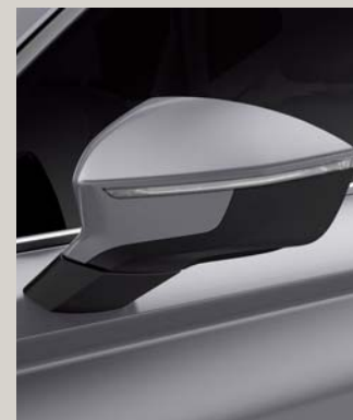
BRILLIANT SILVER 2