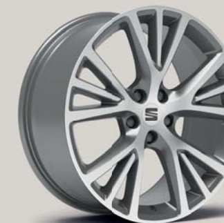
EXCLUSIVE36/4 MACHINED NUCLEAR GREY XP