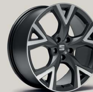
EXCLUSIVE 36/9 MACHINED COSMO GREY FR