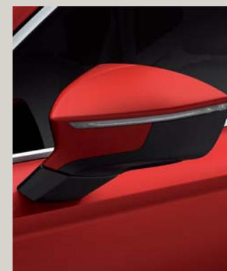
VELVET RED 2