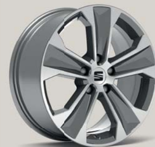
DYNAMIC 36/1 MACHINED NUCLEAR GREY St