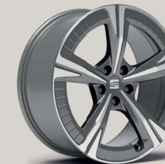
EXCLUSIVE 36/5 MACHINED AERO NUCLEAR GREY XP