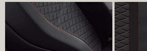
TAPICERKA CZARNA DINAMICA® Z EKOSKÓRĄ