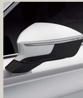
BILA WHITE 1

* Dla wersji FR lusterka zewnętrzne w kolorze Cosmo Grey