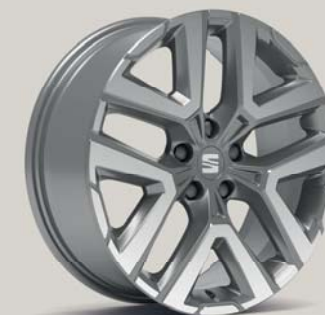
PERFORMANCE 36/8 NUCLEAR GREY St XP