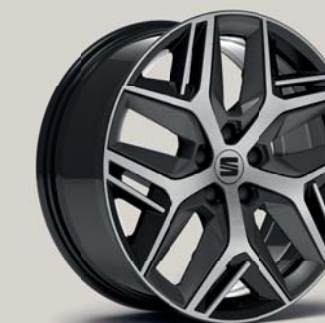
EXCLUSIVE 36/7 MACHINED COSMO GREY FR