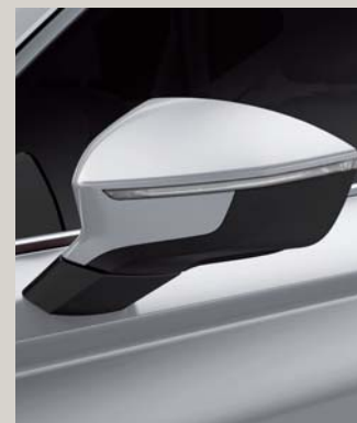
NEVADA WHITE 2