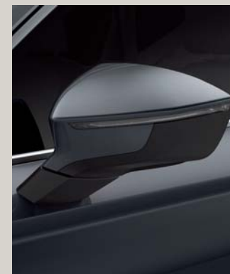
RODIUM GREY 2