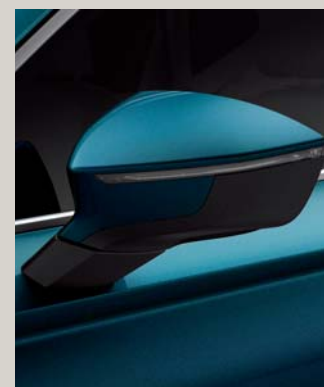
LAVA BLUE 2