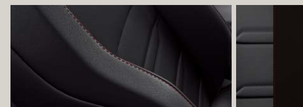
TAPICERKA CZARNA SKÓRZANA Z EKOSKÓRĄ