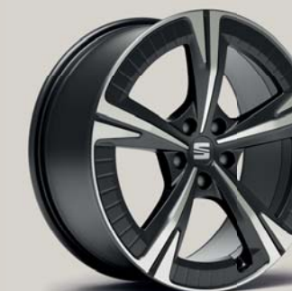
EXCLUSIVE 36/6 MACHINED AERO COSMO GREY FR