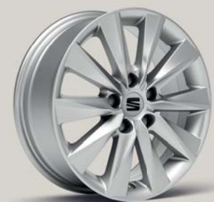
DESIGN 36/1 BRILLIANT SILVER R