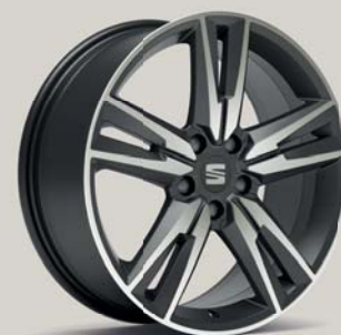
PERFORMANCE 36/3 MACHINED COSMO GREY FR