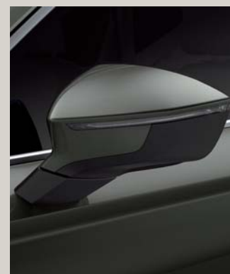
DARK CAMOUFLAGE 2