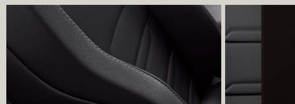
TAPICERKA CZARNA SKÓRZANA