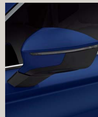
ENERGY BLUE 1