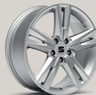
PERFORMANCE 36/3 BRILLIANT SILVER FR