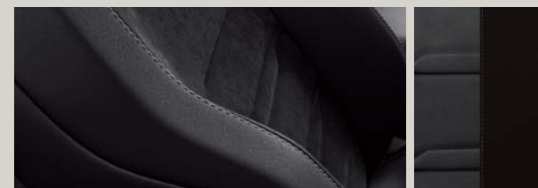
TAPICERKA CZARNA DINAMICA® Z EKOSKÓRĄ