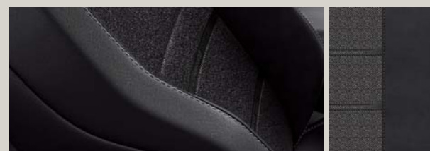
TAPICERKA CZARNA DINAMICA® Z EKOSKÓRĄ