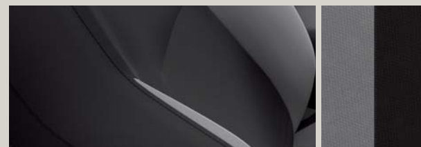
CZARNO-SZARA TAPICERKA MATERIAŁOWA