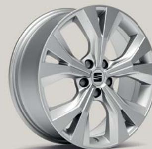
PERFORMANCE 36/1 BRILLIANT SILVER XP